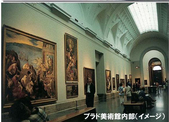
プラド美術館内部(イメージ)