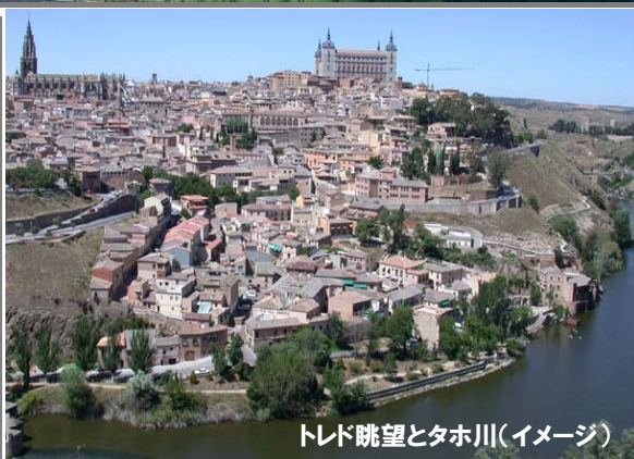
トレド眺望とタホ川(イメージ)

『掲載している写真は撮影時のアングル・天候など諸条件により、実際にご覧になる景観とは異なる場合があります。また「イメージ」と付記されている写真は、旅行日程とは関係ない旅行目的地のイメージ、旅情等を表現したものです。