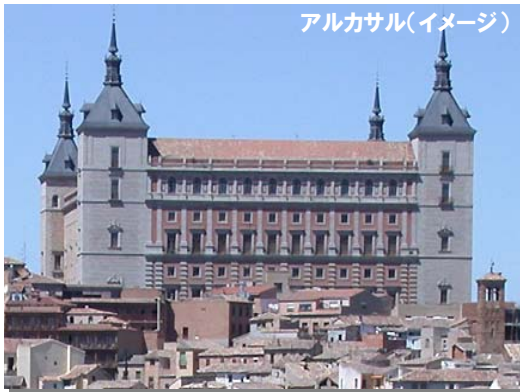
アルカサル(イメージ)

マドリッドはイベリア半島中央部に位置するスペインの首都。美術館・博物館が街に点在し、プラド美術館、国立ソフィア王妃芸術センター、ティツセン・ボルネミッサ美術館は、マドリッドを代表する三大美術館です。中央郵便局のあるシベールス広場を中心として主要道路が交差しており、広場を中心に美術館や歴史的建造物が軒を連ねています。本場の闘牛、フラメンコなど、独特の文化も是非堪能してみたい街です。