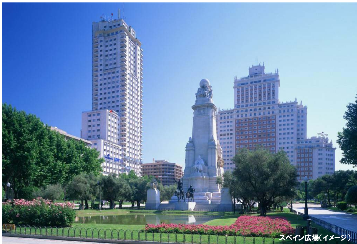
スペイン広場(イメージ)